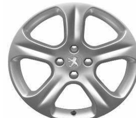
Jante alliage EXONA 18"