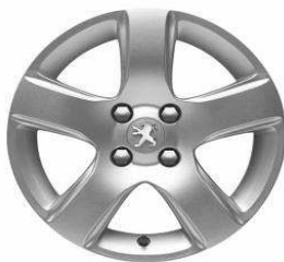
Jante alliage ISARA 16" (Uniquement avec option Grip Control)