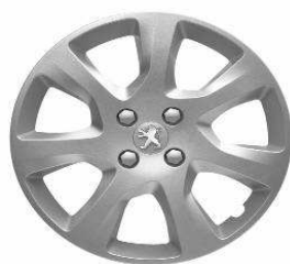
Enjoliveur ATAX 17"

Toutes les jantes de 3008 sont chaînables. Les jantes 17" et 18" sont chaînables avec jeux réduits.