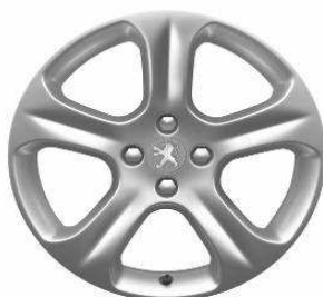
Jante alliage EXONA 18"