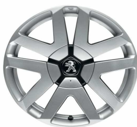
Jante alliage OLTIS 17"