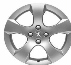
Jante alliage SAVARA 17"